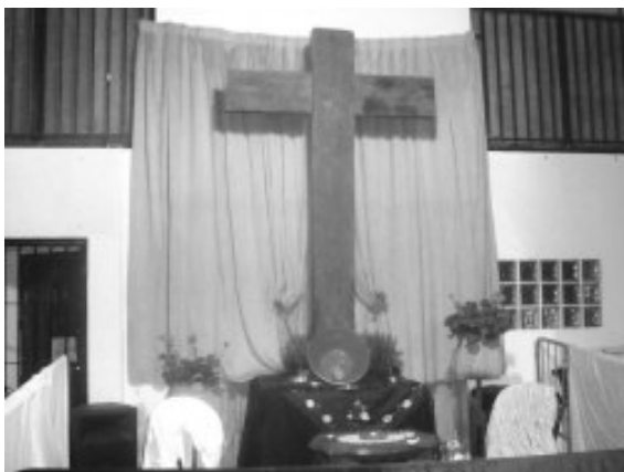
Cruz instalada en los arcos de la Plaza. Día de la Cruz 2009