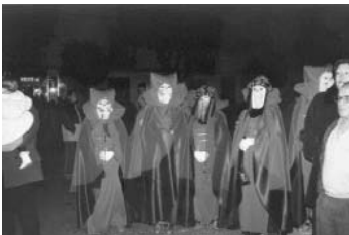
Varias comparsas acudieron a la plaza

Con más de media hora de retraso respecto al horario previsto, el sábado 9 de Febrero se iniciaba el Desfile de Comparsas casi a las 21.45 horas. Cuatro agrupaciones concursaban para la consecución de los premios a la « Mejor comparsa desfilando » (120,20 euros), « Mejor indumentaria » (180,30 euros), y « Mejor letra » (otros 120,20 euros). Sin embargo, sólo hubo participación relacionada con los dos primeros premios. Durante un buen rato, la Plaza estuvo animada con los ladridos de « 101 Dálmatas »,