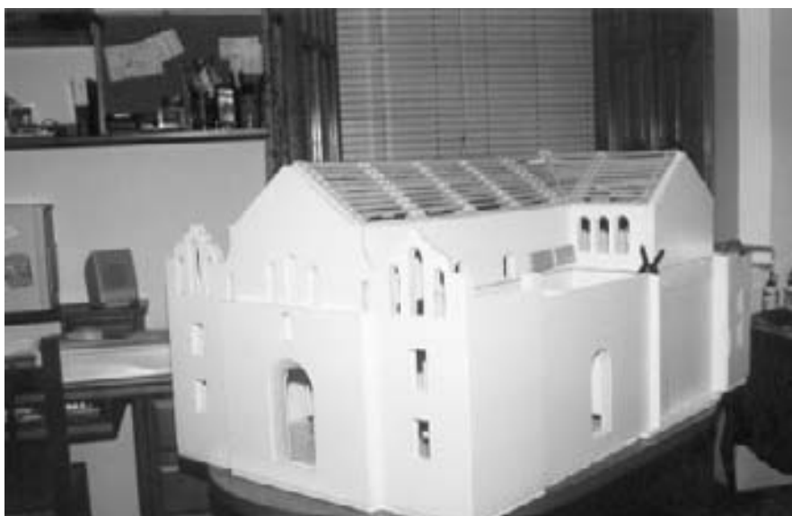
Imagen exterior de la maqueta de la Iglesia.

Pues menudo proyecto. Ojalá que nunca le falten las fuerzas ni las ganas y que dentro de poco tiempo podamos verlo hecho realidad. Viendo cómo resultó la primera maqueta y cómo va ésta, creemos que toda la Plaza resultará impresionante. ¡Muchos ánimos!