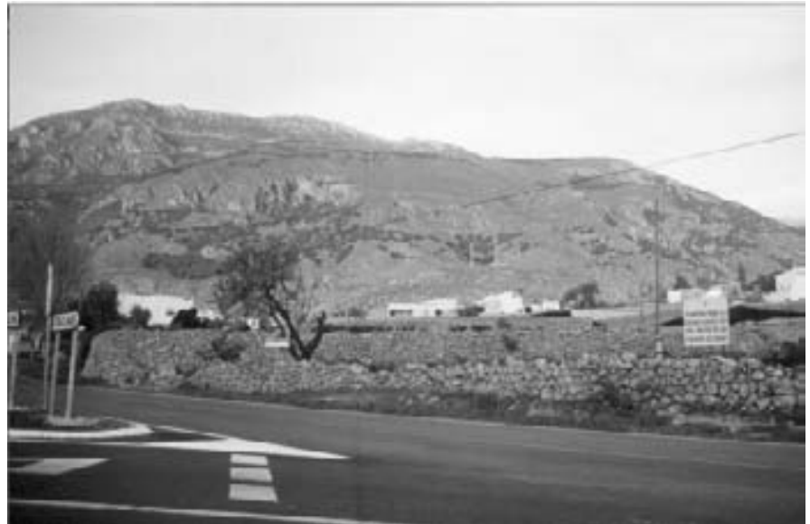
Terreno donde se construirá el IES

(BOJA núm. 19, de 14-02-2002; pág. 2.304)