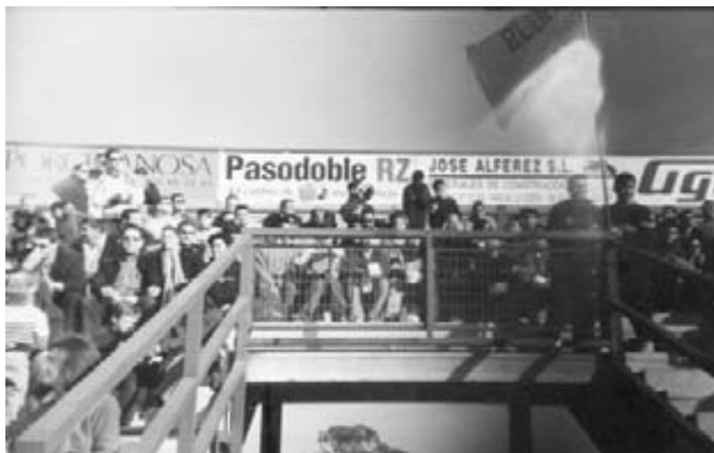
La Peña Blues Ultras, incansable, anima al «Poli»

Ya tenemos todo eso: la peña se llama «Blues Ultras», y además tenemos una sede en la que celebramos las reuniones. Llevamos dos semanas siendo peña del Polideportivo Ejido y ya somos más de 30 socios.