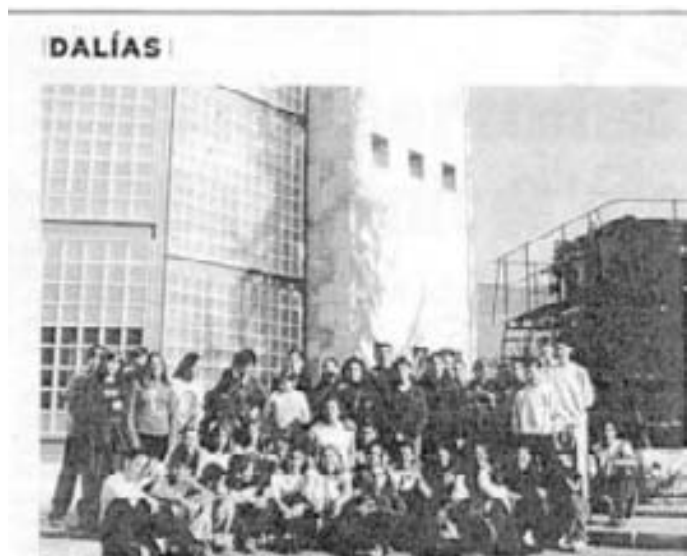
GENTE. Alumnos y profesores visitan IDEAL en Granada.

Varios alumnos y alumnas de 1º y 2º de ESO