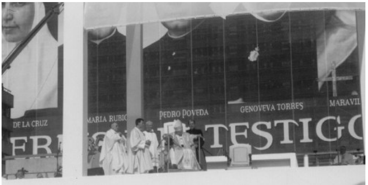
Llegada del Papa Juan Pablo II a la tribuna de celebración de la Ceremonia de Canonización de los nuevos cinco santos españoles, entre ellos, el daliense José M a Rubio Peralta, en Madrid, el día 4 de Mayo.