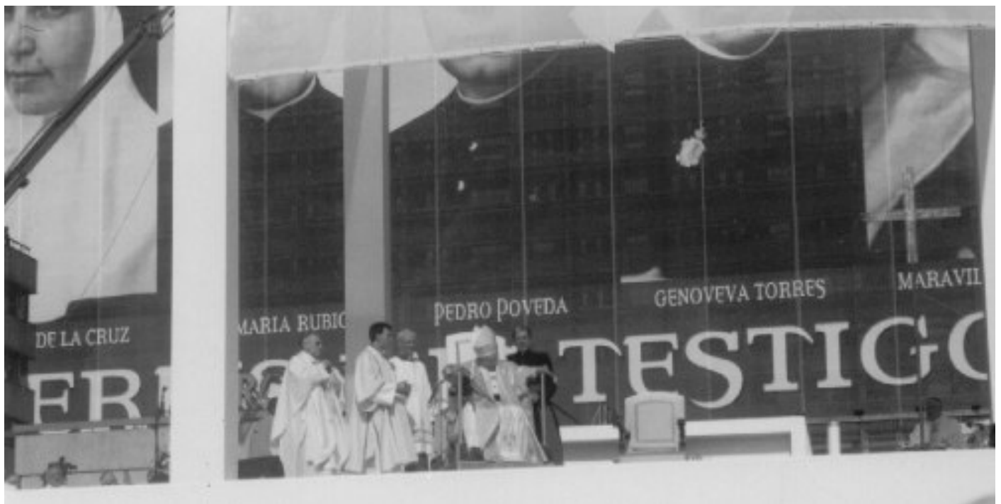
Llegada del Papa Juan Pablo II a la tribuna de celebración de la Ceremonia de Canonización de los nuevos cinco santos españoles, entre ellos, el daliense José M a Rubio Peralta, en Madrid, el día 4 de Mayo.